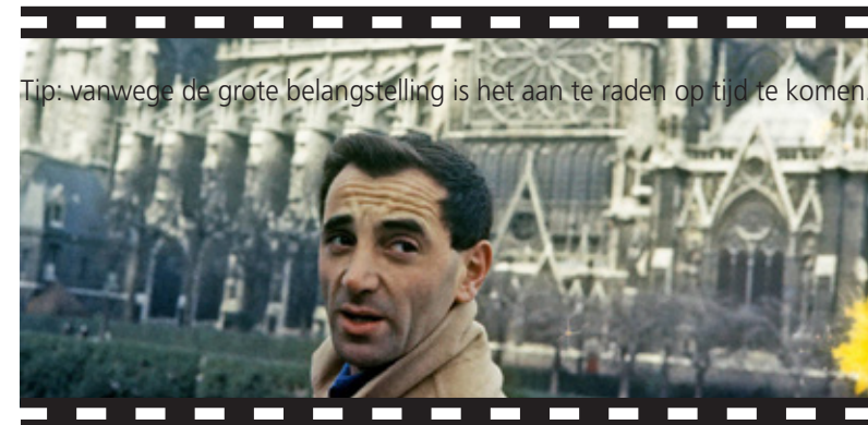
Tip: vanwege de grote belangstelling is het aan te raden op tijd te komen.

Vrijdag 17 september wordt het startschot gegeven met een filmvoorstelling in de tuin van de Tindalvilla aan de Nieuwe 's Gravelandseweg 21 in Bussum. AZNAVOUR, LE REGARD DE CHARLES is een heerlijke combinatie tussen de muziek van Aznavour en zijn blik op de wereld. De belangstelling is zo groot, dat deze voorstelling inmiddels is UITVERKOCHT! Door de nog geldende corona-maatregelen waren er slechts 125 plaatsen beschikbaar. Wij hopen volgend jaar weer meer mensen blij te kunnen maken met de Openluchtfilm. Kleine tip: Hou de website van www.Filmhuisbussum.nl in de gaten voor eventuele retouren van reserveringen!